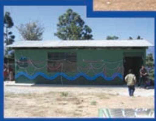
Cocina Comunal, Canoj, Los Horcones, Guacachipol, Santa Bárbara, Huehuetenango