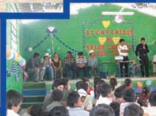
Salón comunal, Canoj Sipacapa