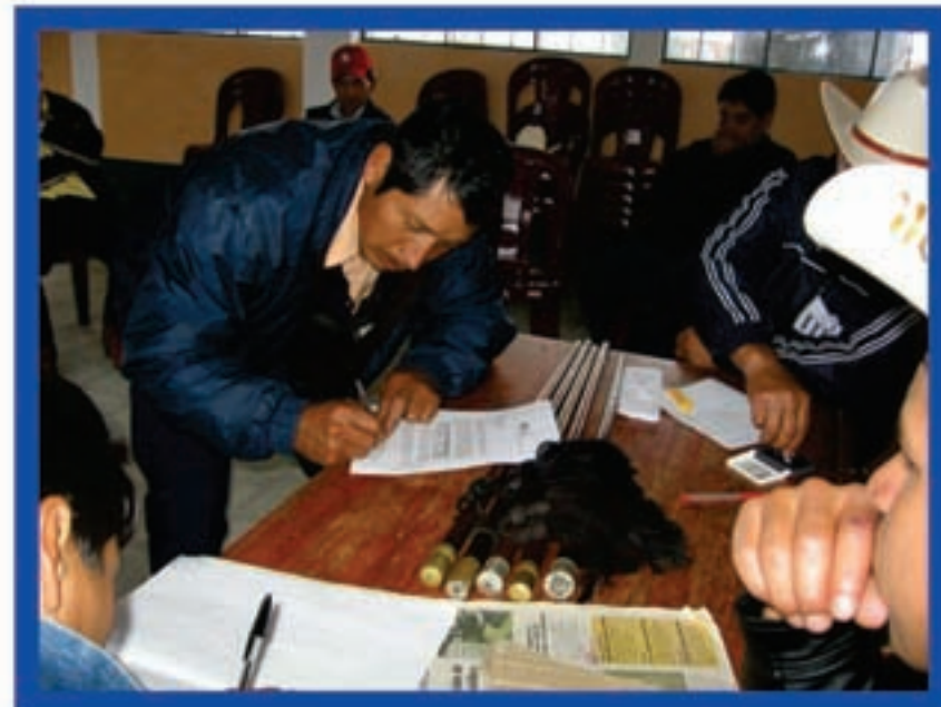
Firma de convenio en Aldea Cancil, Sipacapa