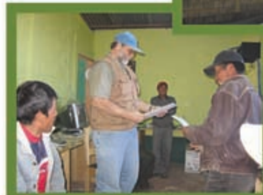
Laboratorio de computo, La Estancia, Sipacapa