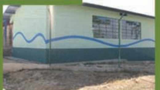
Esuela de 2 aulas, Nueva Victoria, Sipacapa