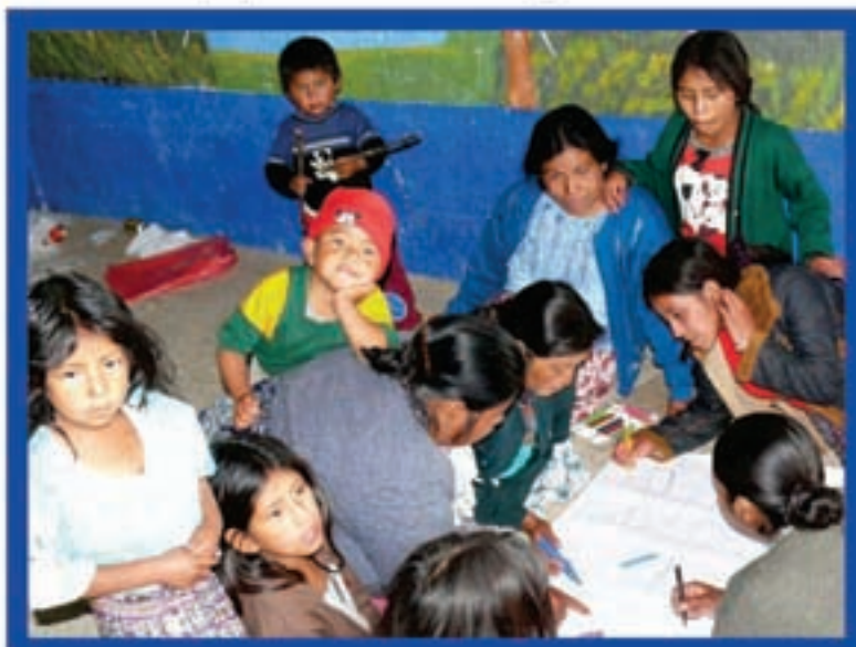
Diagnóstico comunitario, aldea Máquivil, San Miguel Ixt.