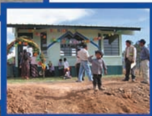
Aula los Horcones, Santa Bárbara, Huehuetenango