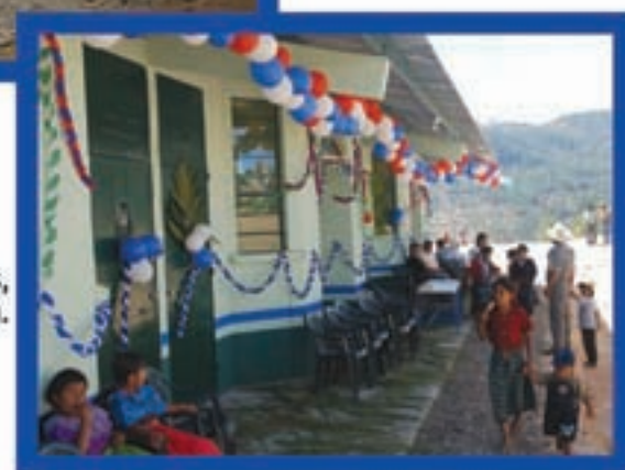
Escuela de tres aulas, Salem, Sipacapa.