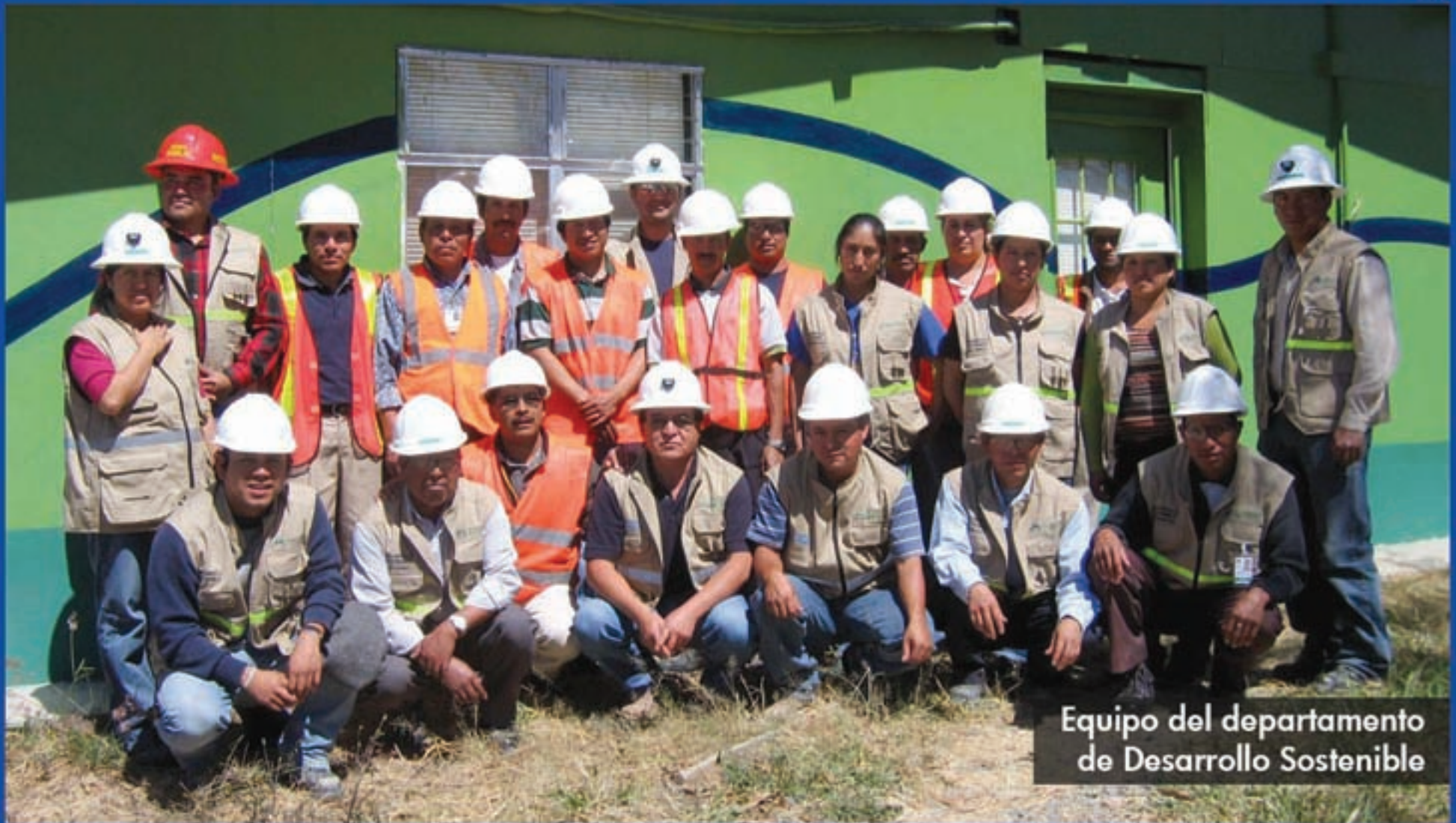
Equipo del departamento de Desarrollo Sostenible