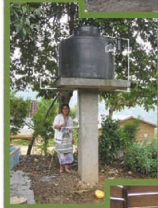
Tanques elevados, Pie de la Cuesta, Sipacapa