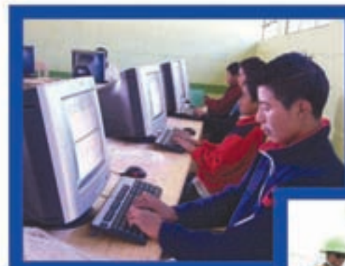
Centro de computo Pueblo Viejo, Sipacapa