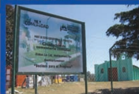
Circulación La Cal, Malacatancito Huehuetenango