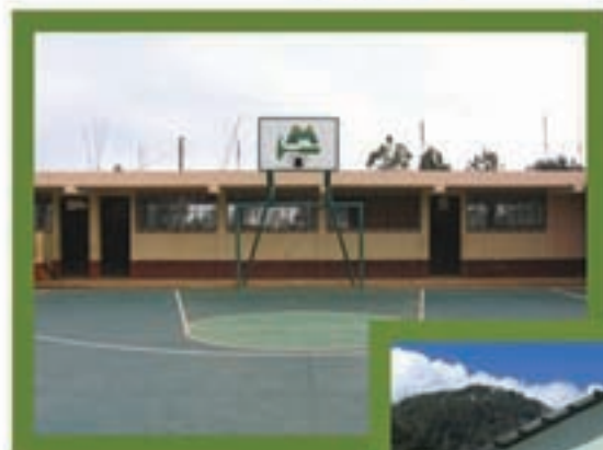
Cancha Polideportiva, Tulcampana, San Miguel Ixt.