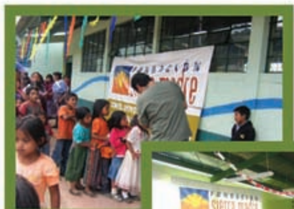
Feria de la salud 2009 Caserio Xeabaj, Sipacapa