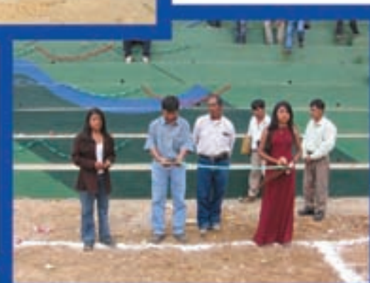
Graderío de campo Tuicampaña San Miguel Ixt.