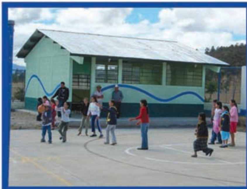
Escuela de 1 aula, aldea La Cal; Malacatancito, Huehuetenango