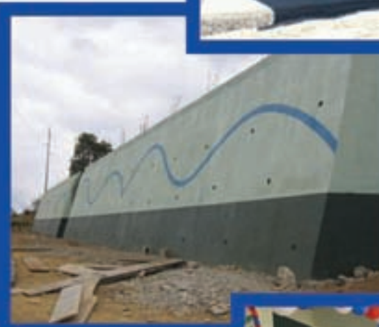
Muro de Contención, Maquivil, San Miguel Ixtahuacán.