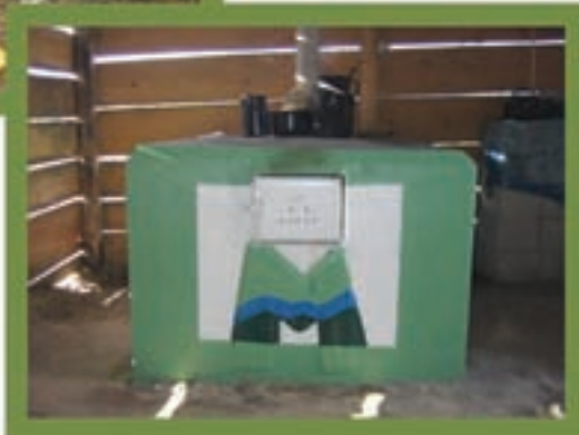
Estufas Horcones, Santa Bárbara, Huehuetenango