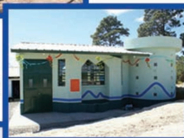
Auxiliatura San Antonio, La Cruz, Sipacapa.