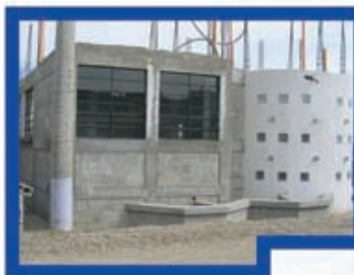
Salón Comunal, San José Ixcániche, San Miguel Ixtahuacán.