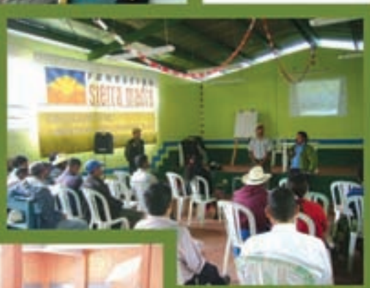
Capacitaciones a caficultores