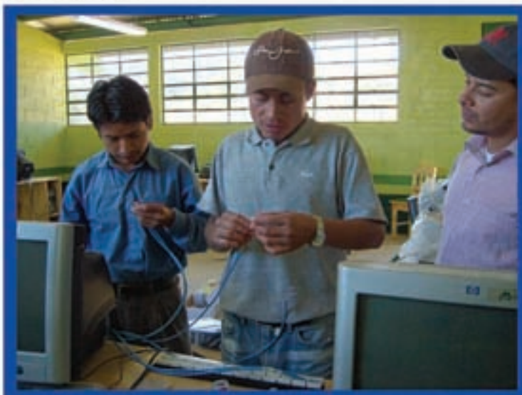
Capacitación en redes, Aldea Pueblo Viejo, Sipacapa.

El compromiso de Goldcorp y su Mina Marlin por medio del departamento de Desarrollo Sostenible, es crear empresarios y empresarias que generen nuevas fuentes de trabajo, líderes que encuentren oportunidades en nuevos mercados, brindar herramientas a las nuevas generaciones y así, afrontar con mayor capacidad los retos que demanda el futuro.