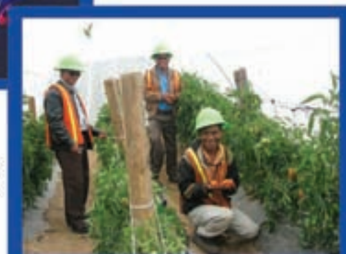
Cultivo de hortalizas por hidropónia