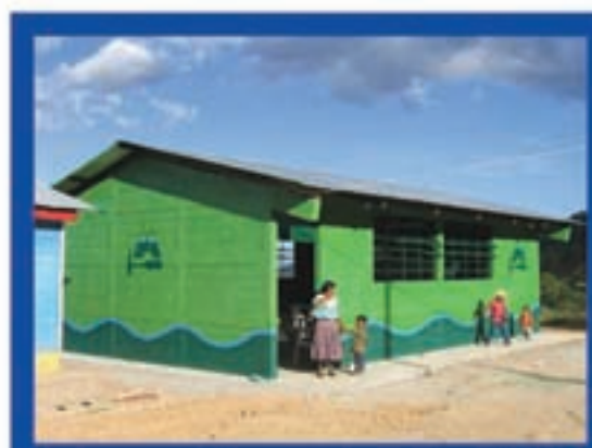
Auxiliatura Carrizal, Sipacapa