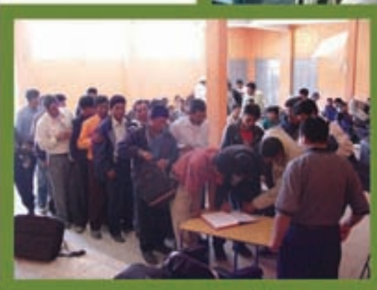
Firma del COMUDE San Miguel Ixt. 2009