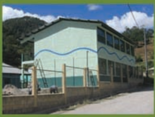
Esuela de 6 aulas, Siete Platos, San Miguel Ixt.