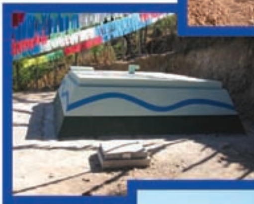
Proyecto de agua potable, Cancil, Sipacapa.