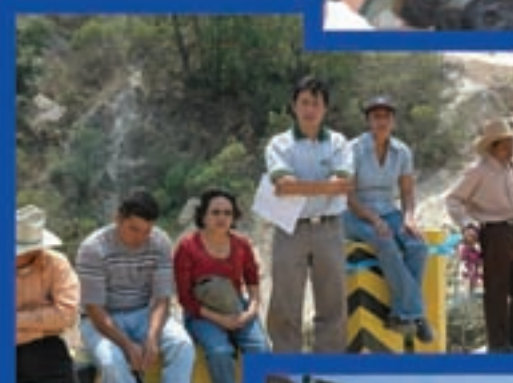
Puente Cantzup, San Miguel Ixt.